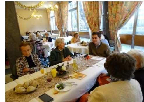
Jour de l'An 2017