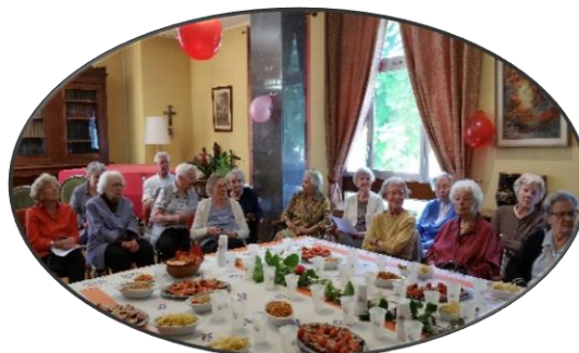
La fête des voisins