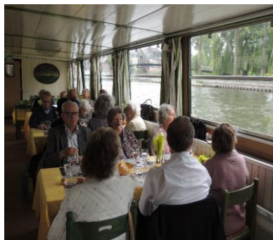
Croisière sur la Somme