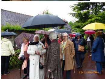
Giverny sous la pluie