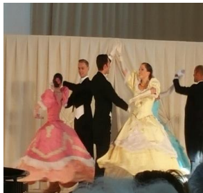
Chœurs Vermeil à l'Orangerie du Parc de Sceaux