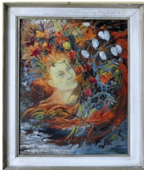
Un tableau par une résidente

Elles permettent aux résidents de continuer à vivre « comme avant » en leur donnant la possibilité de se distraire en fonction de leurs goûts, de leur histoire, du niveau culturel de chacun.