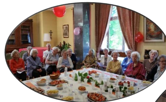
La fête des voisins